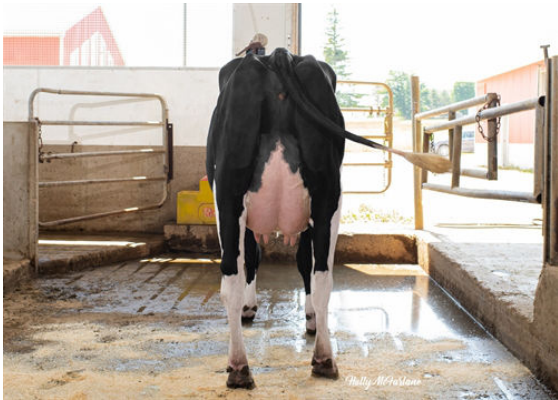
PROGENESIS CHARLEY TULIP THIRD DAM