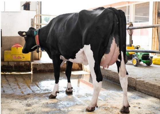
PROGENESIS CHARLEY TULIP THIRD DAM