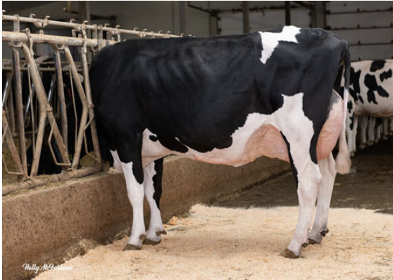
PROGENESIS POSITIVE TRILLIUM GRANDDAM